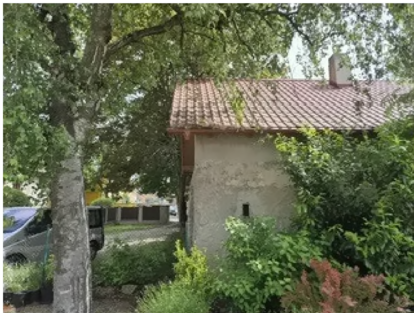
Pohled na štít domu č. p. 35 ze severu s přesahem střechy nad Pozemek.

Pozemek bezprostředně přiléhá k severovýchodnímu štítu domu č.p. 35, Malešické náměstí, Praha 10 a je ve správě OŽP. Vzhledem k tomu, že stavební práce již byly provedeny, nebude po dohodě s vedoucím OŽP vyžadováno stanovisko OŽP.