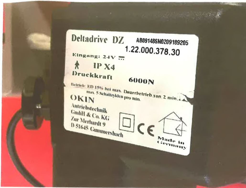
obr. č.6 motor - polohovací postel Proma Reha