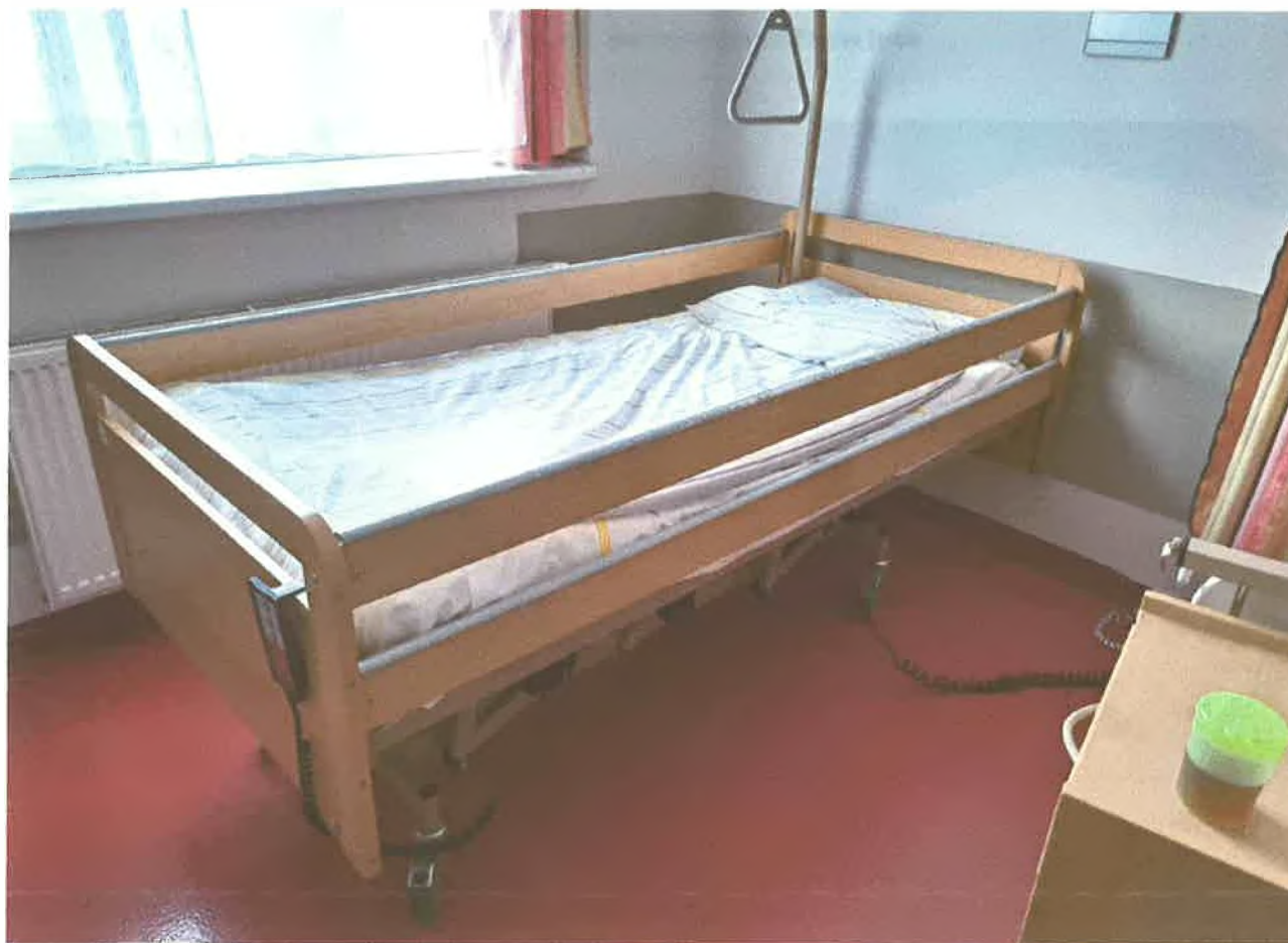
obr. č. 5 polohovací postel Proma Reha - PLE-U85-O