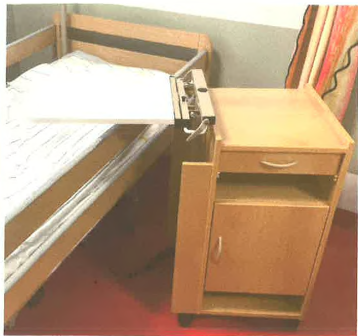
obr. č.8 noční stolek pojízdný Proma Reha