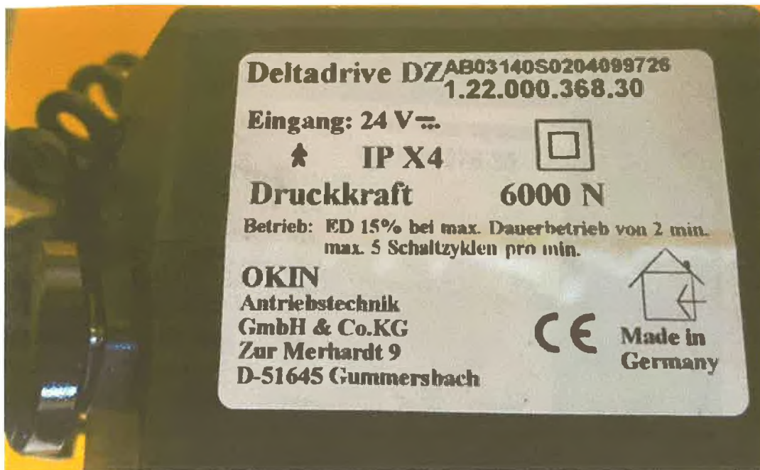
obr. č.4 motor - polohovací postel Linet