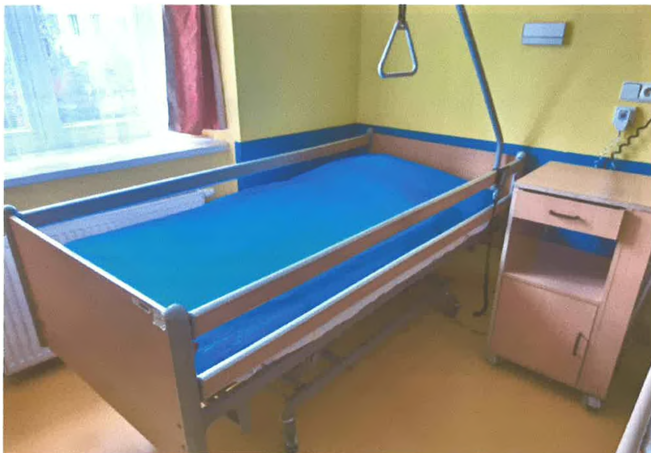
obr. č.3 polohovací postel Linet - Terno plus