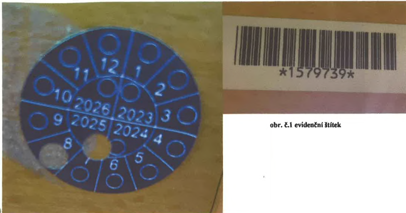
obr. č.1 evidenční štítek