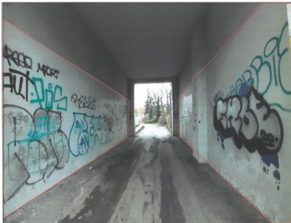
Příloha č. 1 – Přesné vymezení předmětu výprosy