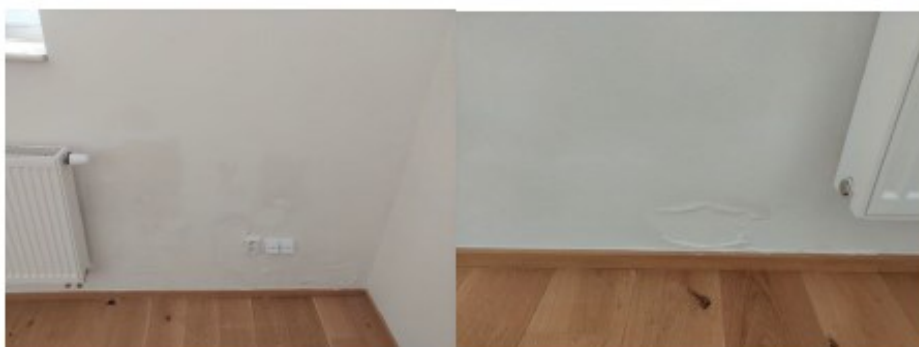
Obrázek 3 Obchod 1.NP