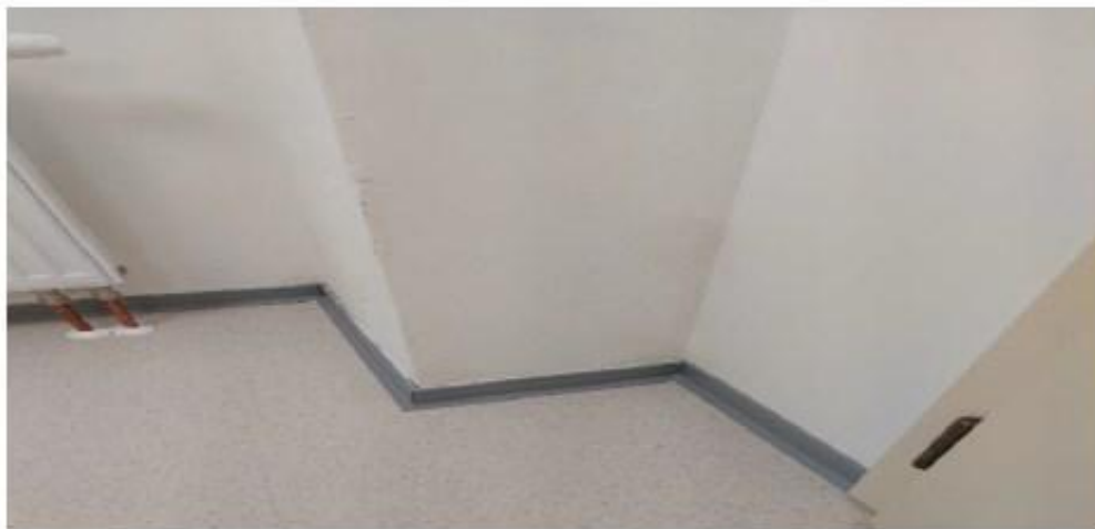
Obrázek 4 Toaleta suterén