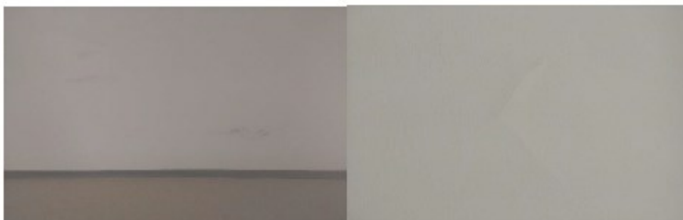
Obrázek 1 Tělocvična PP