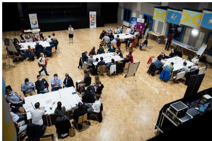
Foto z akce Akční plán v akci 20.10.2021

V roce 2021 byli občané zapojeni do tvorby Akčního plánu pro rok 2022 tím, že podali 112 námětů na projekty. Na podzim roku 2021 byla uspořádána veřejná akce, na níž se občané seznámili s projekty Akčního plánu. Akce se účastnili i odbory ÚMČ Praha 10, radní a někteří zastupitelé.