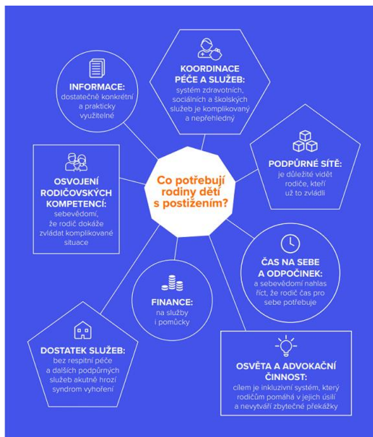
Tabulka č. 14 Systematický přehled empirických studií o potřebách rodin dětí s postižením nebo chronickým onemocněním. Schola Empirica pro Nadační fond Avast, 2019. Zdroj: https://cdn2.hubspot.net/hubfs/486579/foundation-files/spolu_do_zivota_prehled_empirickyh_studiij.pdf