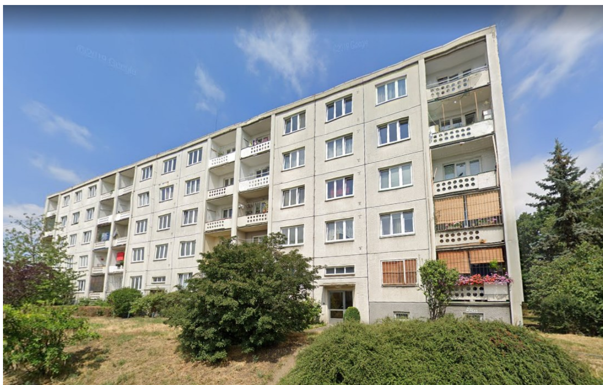
Pohled na dům č. p. 2046 - 2048 z Hostýnské ulice

Dotčenými pozemky ve správě MČ Praha 10 jsou parc. č. 2244/173 (druh pozemku: ostatní plocha, využití pozemku: zeleň, o výměře 9136 m 2 ) a 2244/230 (druh pozemku: ostatní plocha, využití pozemku: ostatní komunikace, o výměře 122 m 2 ) , oba v k. ú. Strašnice, obec Praha, (dále jen jako „Pozemky“).