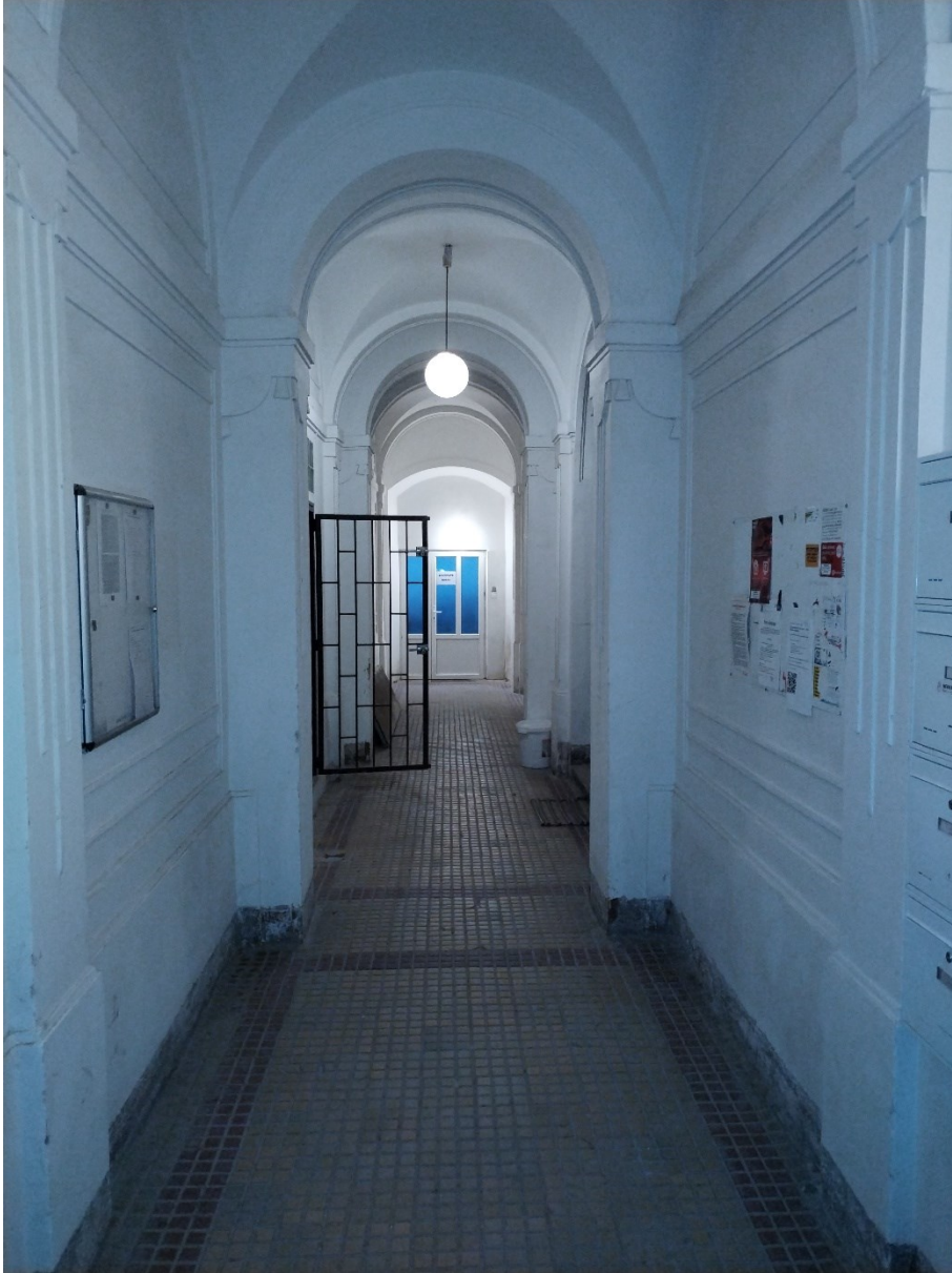
Průchod domem rozděluje jednotku 444/13 na dvě části

Zároveň bylo rozhodnuto rozdělit tuto jednotku č. 444/13 (plocha 135 m 2 ) na dvě samostatné části, a to na č. 444/13 (plocha 81 m 2 ) a č. 444/17 (plocha 54 m 2 ), důvodem je, že jednotka č. 444/13 je rozdělena průjezdem (průchodem), přičemž obě části mají samostatný přístup z ulice Kodaňská, a to včetně vlastních toalet.